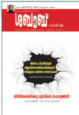
കവർ: ഫവാസ് തീരുരങ്ങാടി